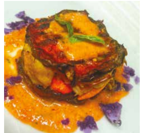
RUDENC Osteria del Corso, Fribourg